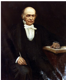
William Rowan Hamilton 1805–1865

V plné obecnosti větu dokázal až roku 1878 F. Frobenius.